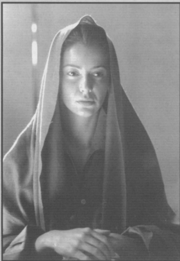
Las pasiones de Sor Juana.

• A LA HORA DE HABLAR de esas dificultades resulta esencial tener muy claro cuáles son las fechas que se están manejando. El tiempo que transcurre desde que se inicia un guión o un rodaje, hasta que se finaliza o estrena una película, nos puede dar una idea aproximada del calvario que a veces supone. Y es aquí donde la disparidad de datos roza el absurdo. Las fuentes consultadas han sido varias: datos del ICAA que figuran en la base del Ministerio de Cultura (en adelante MCU), Anuarios del ICAA, Academia. Revista del Cine Español, Academia. Noticias del Cine Español, EGEDA, catálogos de festivales, declaraciones de directores, productores, etc. El cruce de todos estos datos ha supuesto,