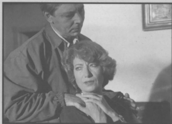
En algún lugar del viento